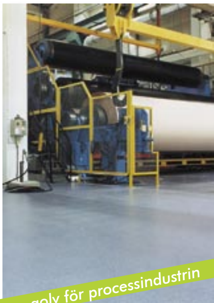
...golv för processindustrin

Från lättare belastning till mycket kvalificerade beläggningar. Avsedda att motstå de kraftigaste belastningar av mekanisk, kemisk och termisk natur.